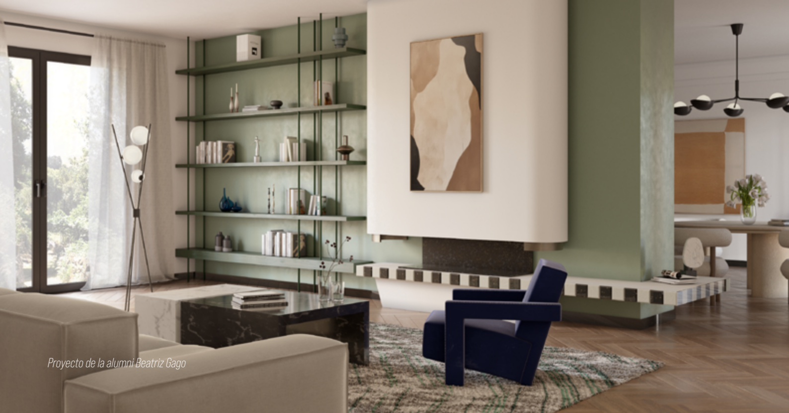
Proyecto de la alumni Beatriz Gago