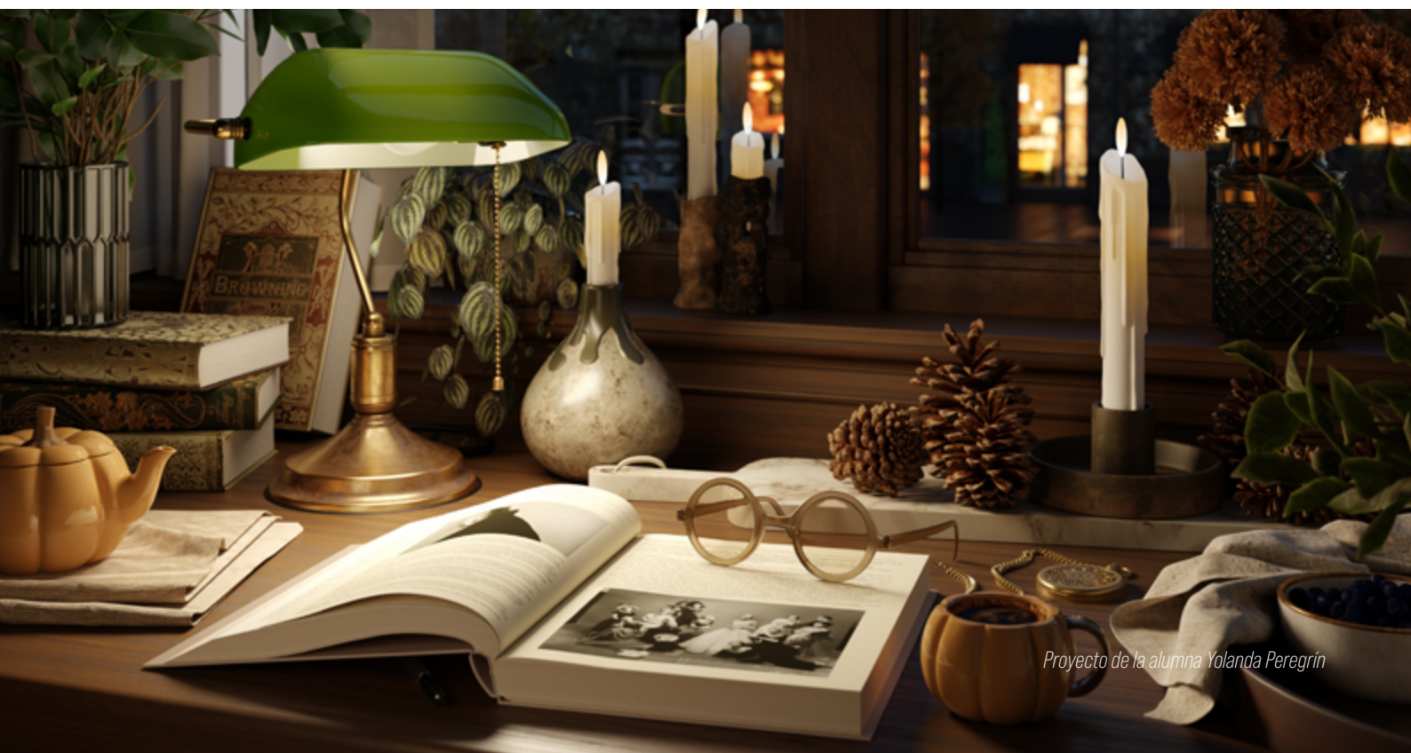
Proyecto de la alumna Yolanda Peregrín

Eres autodidacta con experiencia que busca estudios y oportunidades profesionales.