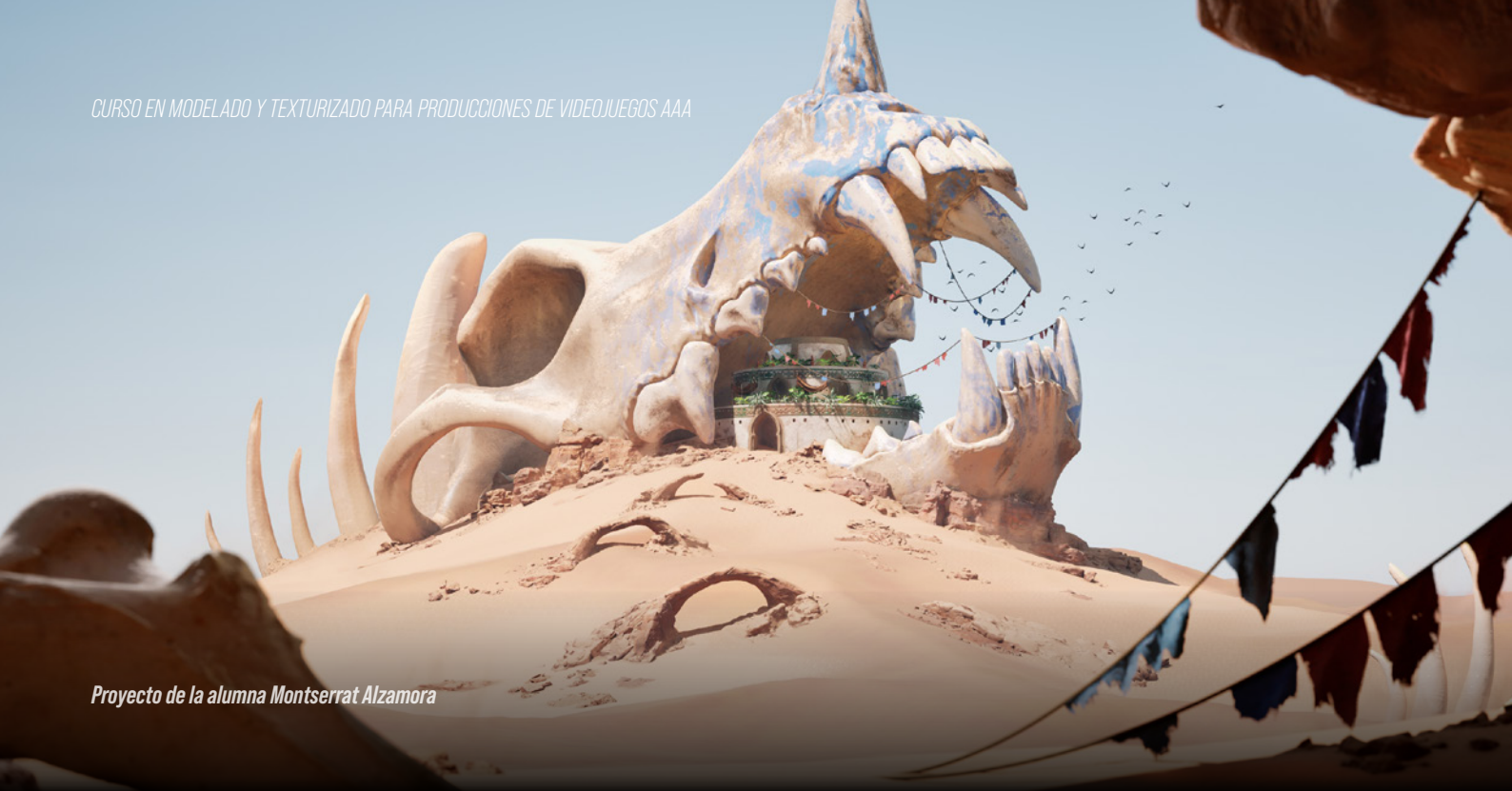
Proyecto de la alumna Montserrat Alzamora